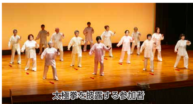
太極拳を披露する参加者

洞 爺湖町文化団体協議会の第41回ふれ合う心の文化広場が、洞爺湖文化センターで開催されました。 13団体が出演し、バイオリンや琴の演奏、合唱、吹奏楽、日本舞踊など様々なプログラムが行われました。 洞爺湖太極拳同好会は人気曲に合わせて演武を披露。円を描くように手足をなめらかに運び、積み重ねた稽古の成果を発揮していました。