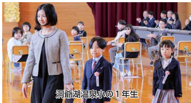
洞爺湖温泉小の1年生