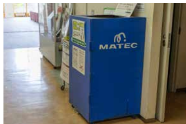
▲役場(本庁舎)の回収ボックス