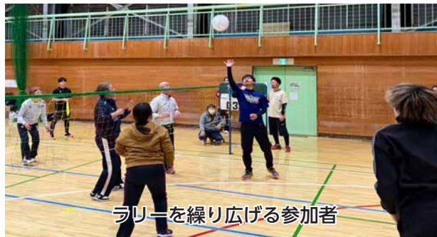
ラリーを繰り広げる参加者

洞 爺湖町体育振興連絡会主催の町民ミニバレー大会があぶた体育館で開催されました。 60人11チームが参加し、予選リーグと決勝トーナメントで優勝を争いました。 各チームは、息の合ったラリーでボールをつなぎ、得点を狙いました。勝利を目指しながらも試合後はお互いの健闘をたたえ、プレーを通じて交流を深めていました。